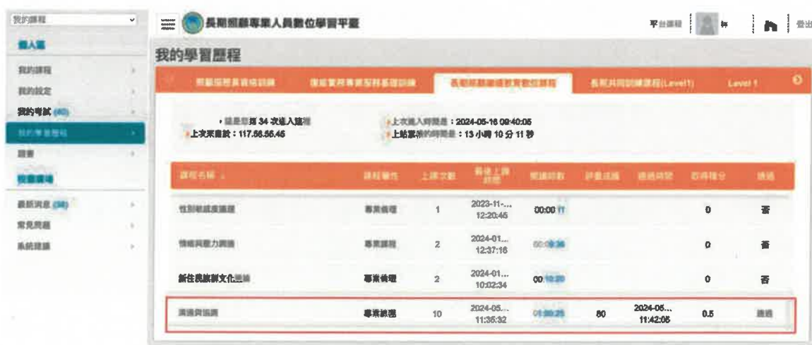
圖 1 長期照顧專業人員數位學習平台積分通過畫面