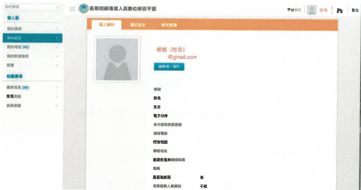
圖 2 長期照顧專業人員數位學習平台個人資料畫面